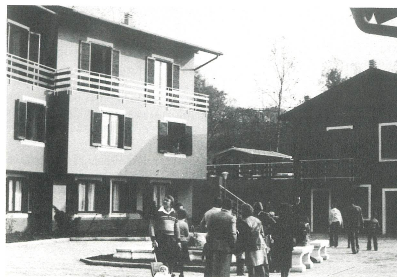
Nella piazzetta con la fontanella, centro del paesino risorto