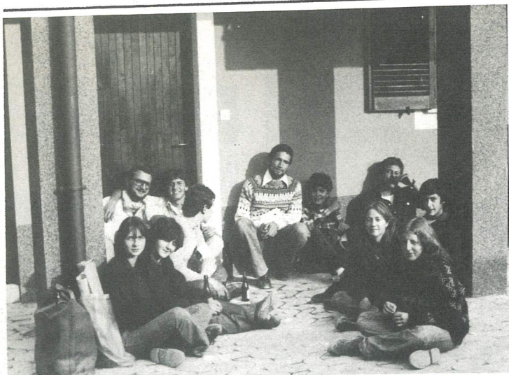
Un gruppetto di volontari zaccarini

te possa essere più pesante di quello di un manovale, per duro che esso sia.