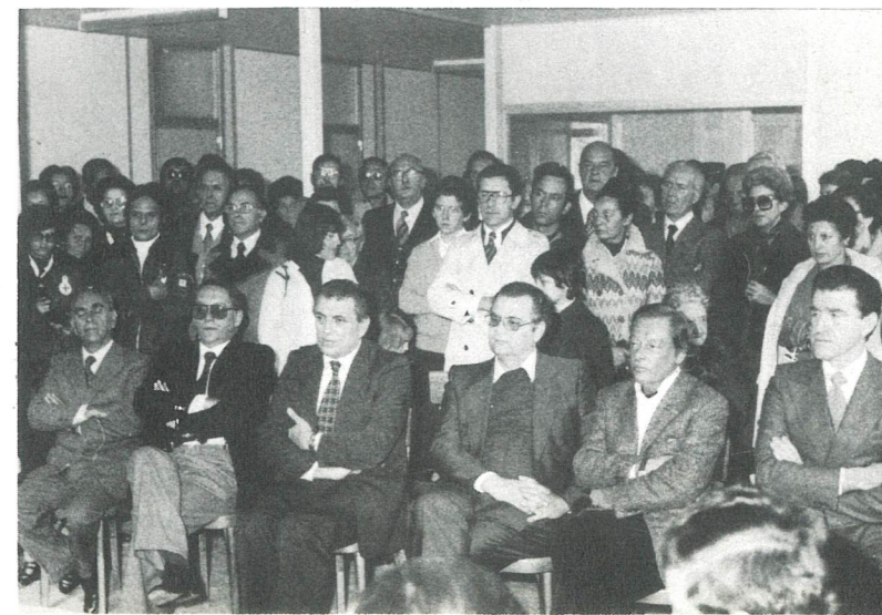
I dirigenti del "Claps Furlans", animatori della rinascita

Il mese di luglio fu impiegato ad allestire tre lunghe baracche, che sarebbero servite prima ai ragazzi e agli operai delle due im-