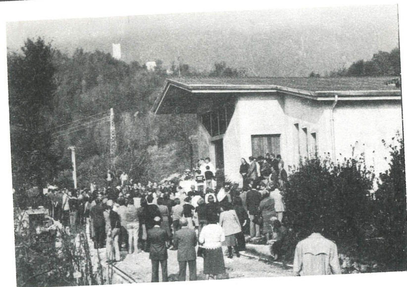
La gente e gli amici di Flaipano assistono alla Messa

Così la gente del posto ritrova lo stesso ambiente, si ricompone, forse meglio di prima, nella propria terra.