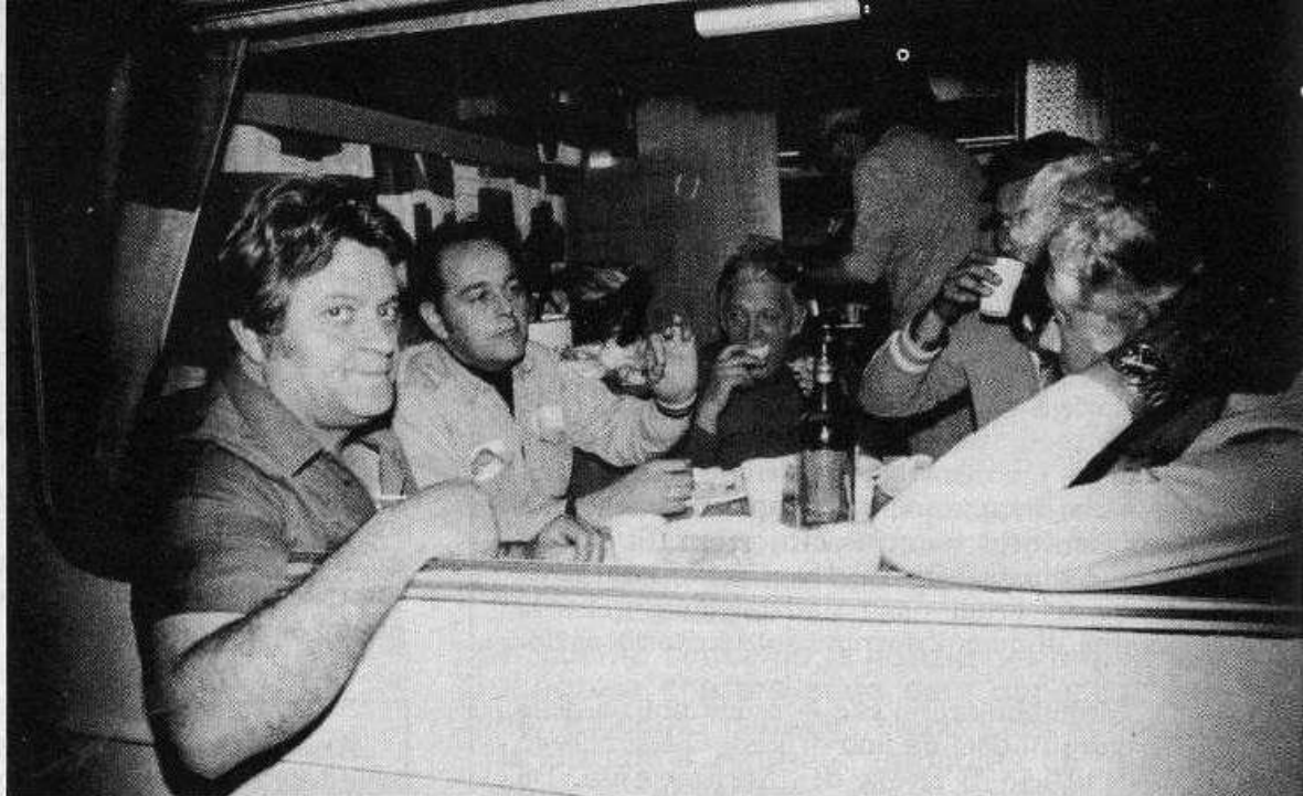
Cena di lavoro: al centro, da sinistra: BAY, MW, RGH (sta bevendo).

La presente relazione non può essere la esatta e completa cronistoria di 15 giorni di lavoro del C.E.R. e dei radioamatori a Gemona.