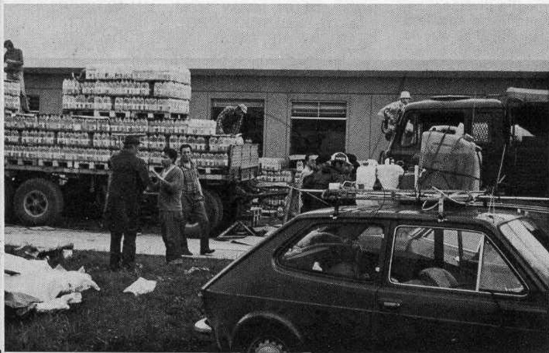
Auto I2GEK, Scuola Deganuti Gemona.

Il Centro Medico Mirano sta ancora operando a Sammardenchia con alcuni suoi mezzi. Le postazioni attive su R9 sono: il Centro Sanitario, la Prefettura, il Centro Operativo, il Centro di Coordinamento, la Caserma Goi, il